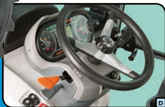
TABLEAU DE BORD ET VOLANT REGLABLE

Le tableau de bord élégant et bien éclairé s'incline avec le volant permettant au conducteur de surveiller constamment les fonctions et la performance du tracteur. L'inclinaison est réglée par le biais d'une pédale commodément placée au-dessous du tableau. Placée à portée de la main sur le tableau de bord se trouve également la commande d'inverseur. (fig. D).